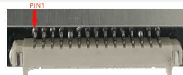
15 PIN W-TO-B 连接器, 1.25mm